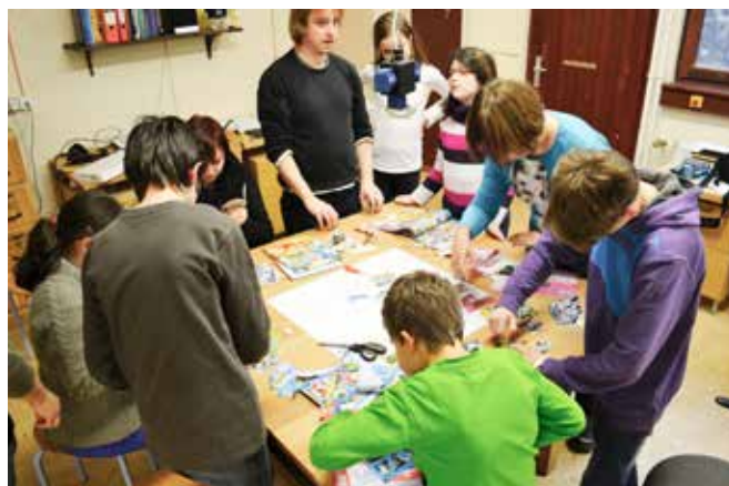
Schüler der Torwiesenschule im Jugendhaus Heslach

Die offene Atmosphäre des Jugendhauses trägt dazu bei, bereits bestehende Kontakte zu intensivieren und neue zu knüpfen, auch zu Jugendlichen aus dem Stadtteil Heslach, die nicht die Torwiesenschule besuchen. Das Jugendhaus hatte sich um eine Kooperation mit der Torwiesenschule bemüht, da die städtische Jugendeinrichtung noch sehr unerfahren mit dem Thema Inklusion war, verbunden mit dem