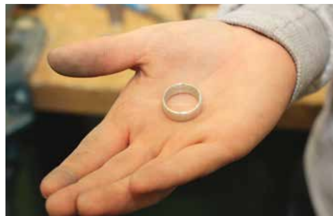
Passt wie angegossen. Stolz präsentiert die junge Frau den Ring, den sie selbst angefertigt hat.